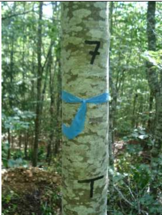
Erable N°7 dégagé.