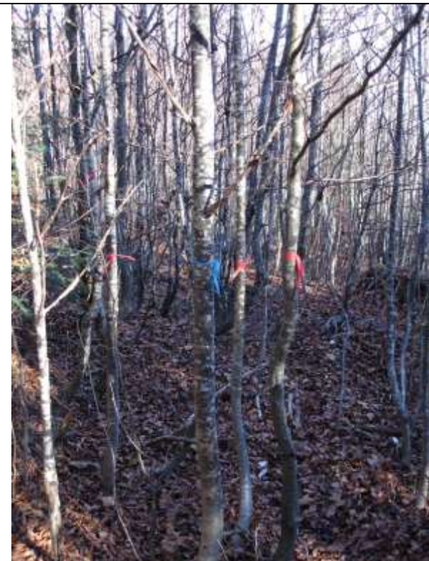
Sorbier des oiseleurs, candidat N°15 (ancien N°10), le 28.10.2005