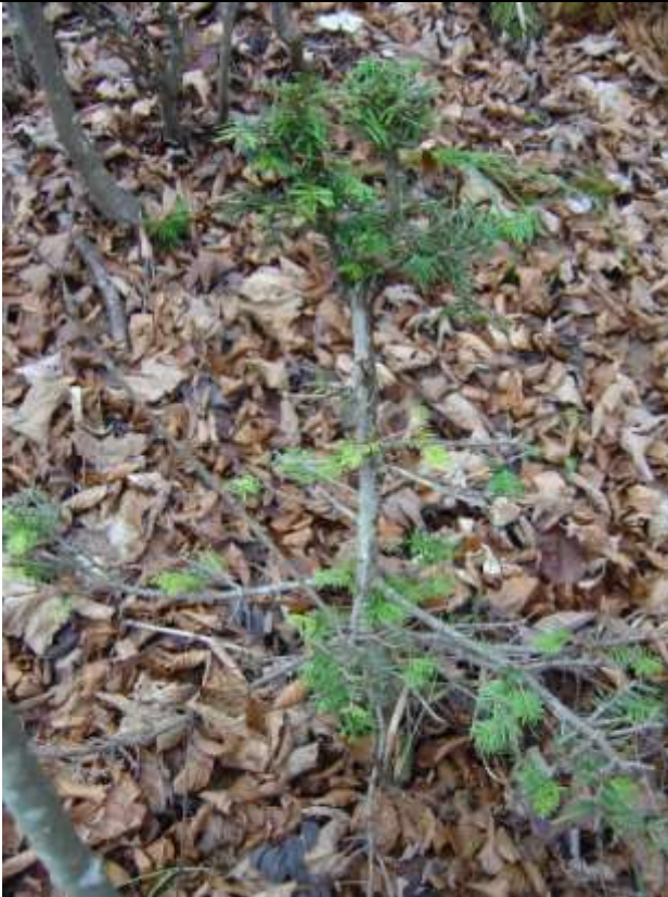
Sapin abrouiti, le 16.11.2004