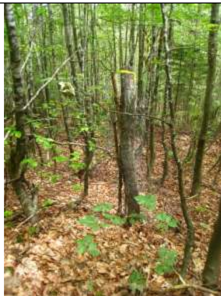
Sur la vingtaine de tiges protégées individuellement en 2005, aucune ne figure dans le réseau 2012 ! Photo 28.6.2012