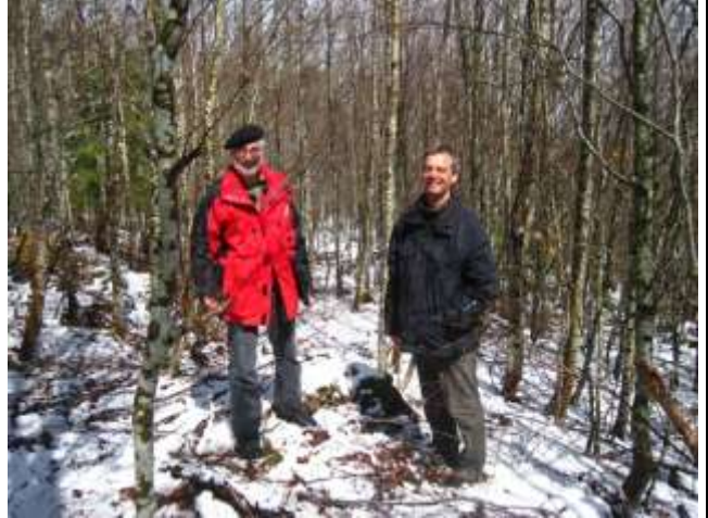
Allure du peuplement, le 11.04.2012.