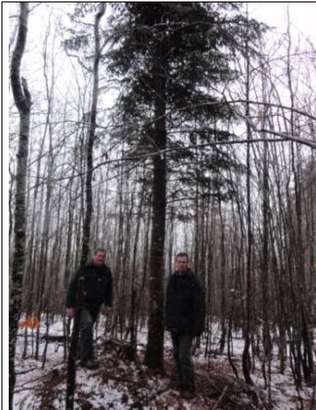
Sapin blanc (N°14), le 11.4.2012.