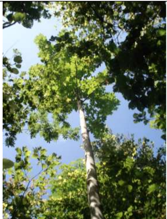
Couronne de l'érable N°7.