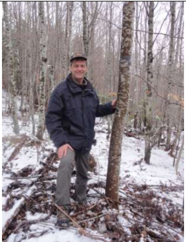
Erable sycomore (N°8), le 11.4.2012.