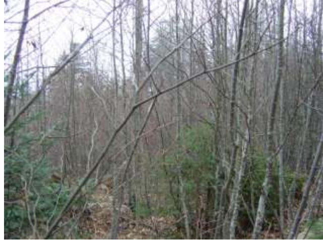
Allure du peuplement, le 16.11.2004