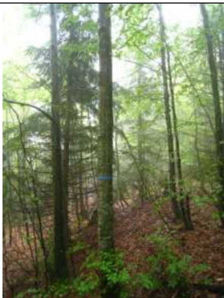
Hêtre dominant, candidat N°13, le 26.6.2012