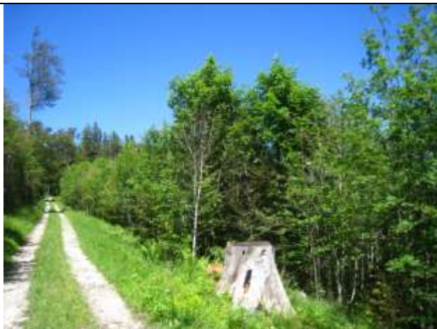
Allure du peuplement, avec candidat N°1 (centre), le 27.6.2012