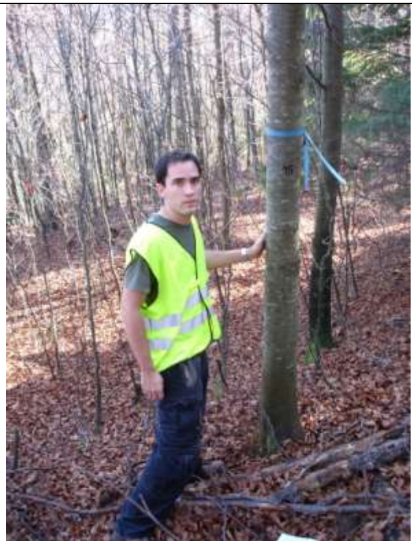
Hêtre dominant, candidat N°13 (ancien N°15), le 28.10.2005