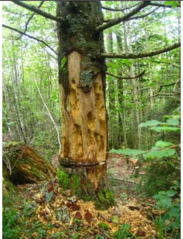
Sapin préexistant dévitalisé en automne 2011, le 24.7.2013