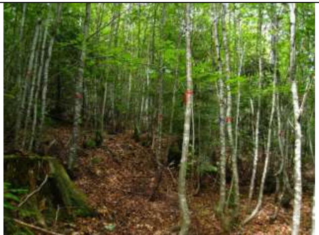
Intervention musclée en faveur du sorbier « B », le 28.6.2012