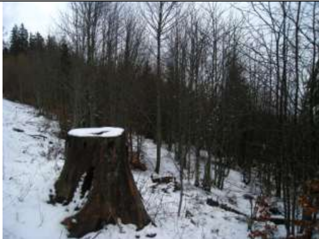
Allure du peuplement, le 11.4.2012. Au centre : candidat N°1