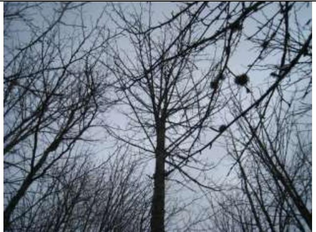
Couronne vigoureuse du candidat N°1, 11.4.2012