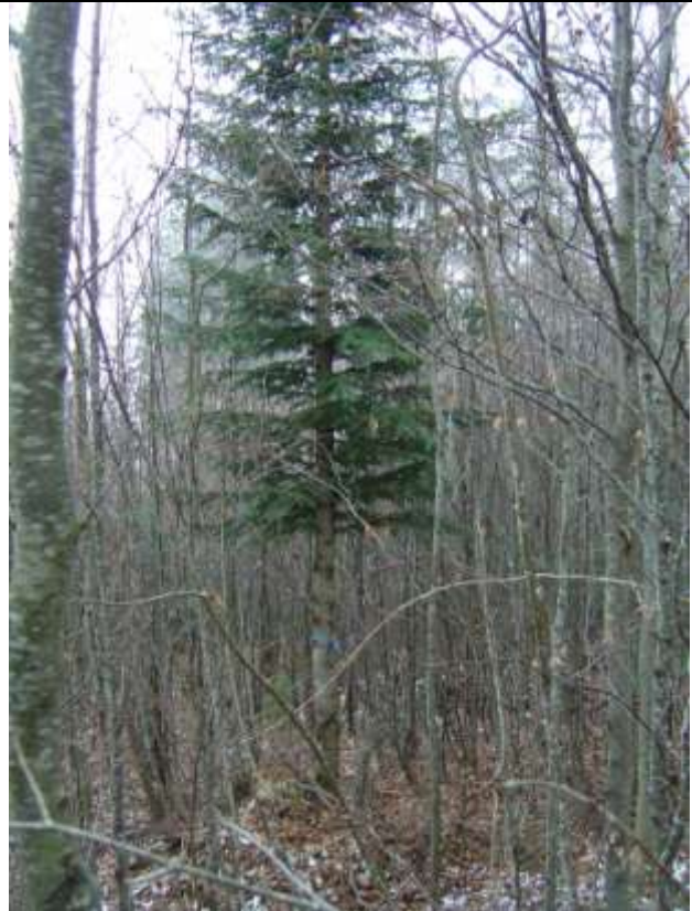
Sapin préexistant candidat, le 16.11.2004