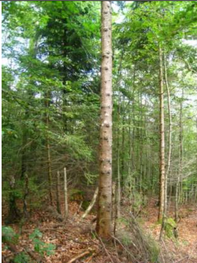
Epicéa « A » élagué en juillet 2012, le 24.7.2013 Pour enrichir le mélange les résineux (sa, ép) sont importants