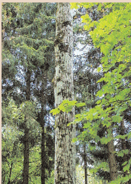
Un arbre de place qui jouit depuis la première intervention du statut de candidat.