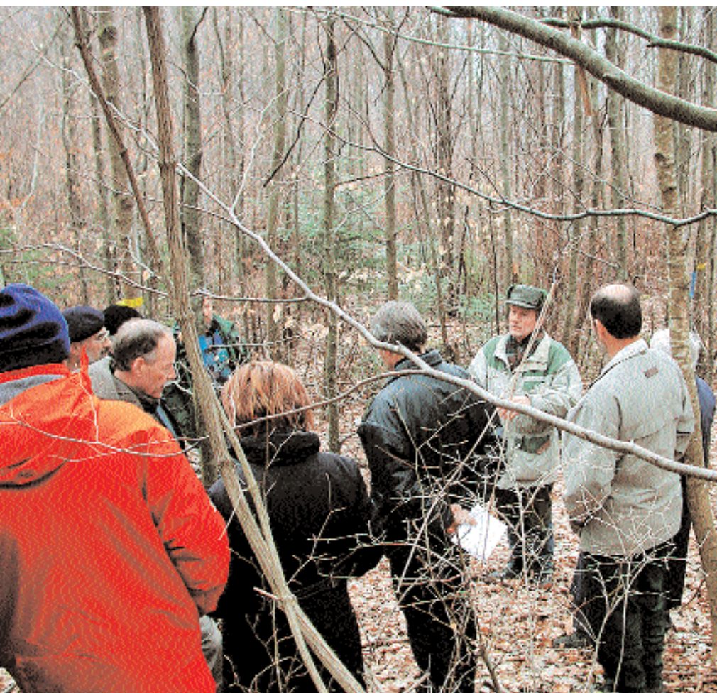
Lors d'une excursion annuelle de la CPP dans la surface d'enseignement de Gitzirain (Longeau BE).