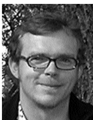
Par Philippe Wohlhauser*

La Communauté suisse du peuplier et des bois précieux est active dans la promotion des bois précieux depuis 1996 déjà. Auparavant, elle avait pour seul cheval de bataille la culture des peupliers. La CCP finance et dirige la première phase du projet. Ses membres regroupent les milieux de la filière du bois et les services forestiers, des communes à la Confédération.